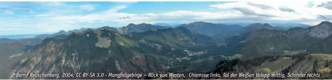
Mangfallgebirge – Blick von Westen, Chiemsee links, Tal der Weißen Valepp mittig, Schinder rechts