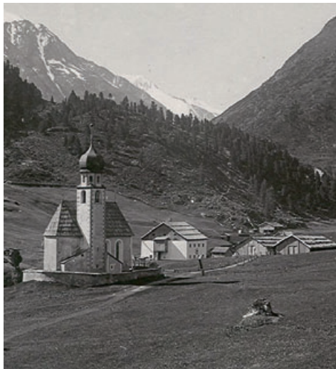
Vent um 1900

OeAV Sektion Zillertal 1. Vors. Paul Steger, oeav.zillertal@aon.at www.alpenverein.at/zillertal