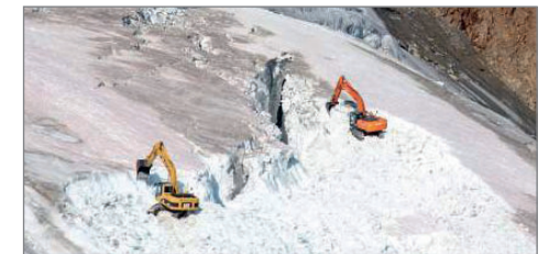
„Bauarbeiten“ am Gletscher

Die Klimaerwärmung ist eine der größten globalen Bedrohungen unserer Zeit. Besonders betroffen sind hier die Natur- und Lebensräume in den Alpen. Das Alpine Museum widmet den Auswirkungen der Klimaerwärmung auf den Alpenraum seine erste Sonderausstellung nach der Wiedereröffnung des Hauses. Die Ausstellung „Zukunft Alpen. Die Klimaerwärmung“ ist vom 25. Oktober 2024 bis 30. August 2026 auf der Praterinsel zu sehen.