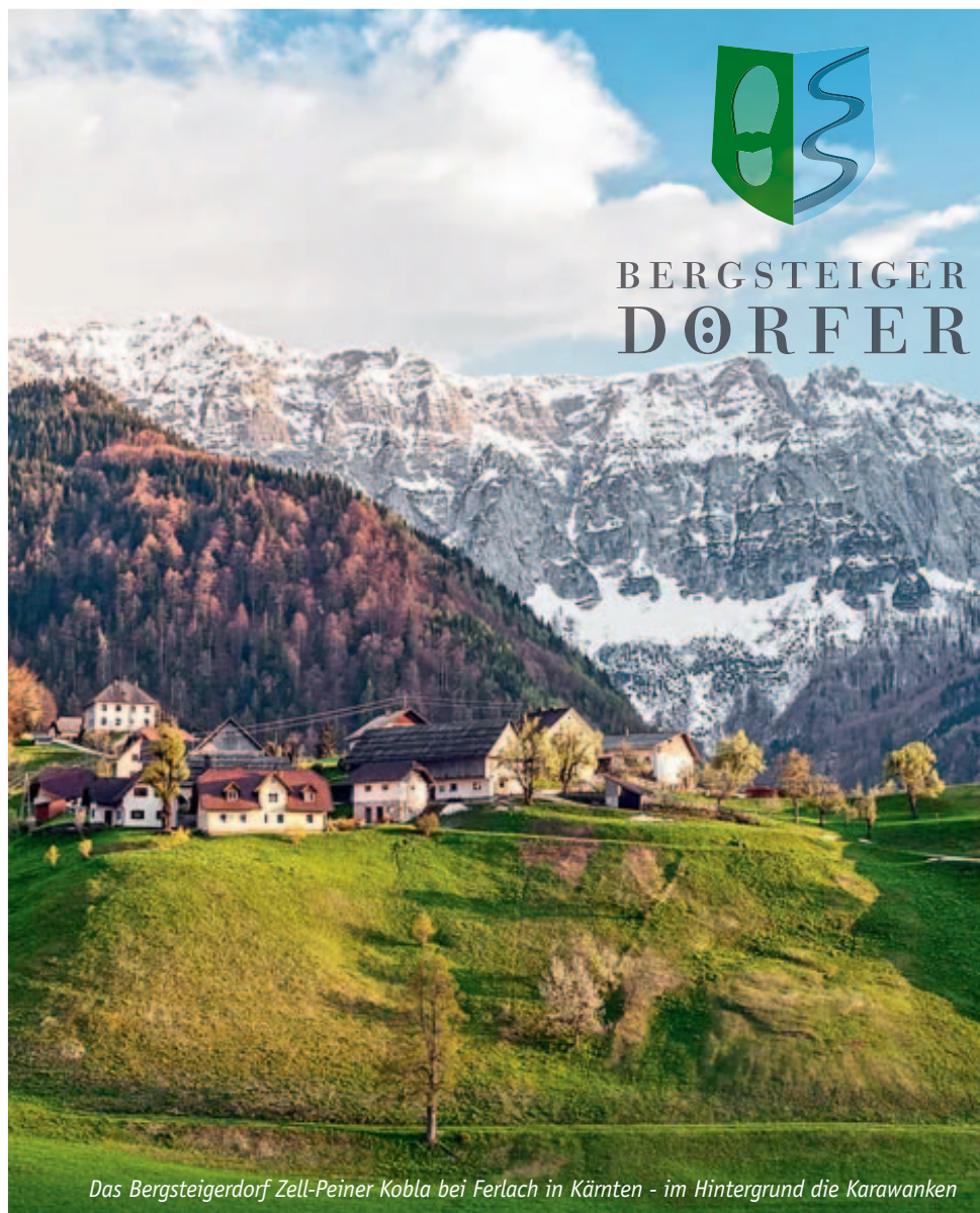
Das Bergsteigerdorf Zell-Peiner Kobla bei Ferlach in Kärnten - im Hintergrund die Karawanken

Von Gerhard Schiweck - Quellenbearbeitung „alpin.de“ und „Webseite Bergsteigerdörfer“