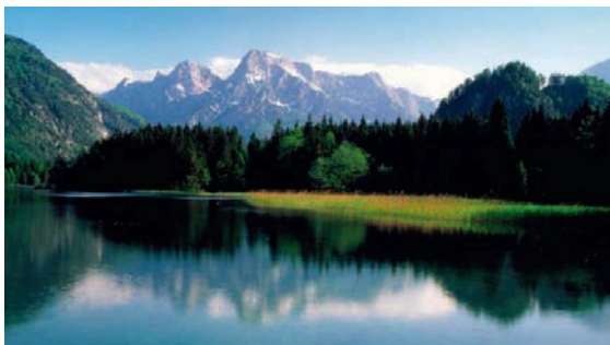
Blick über den Almsee zum Zwölferkogel (2102m)

Grünau im Almtal befindet sich im nordöstlichen Salzkammergut im Bezirk Gmunden und liegt auf 528 m Seehöhe. Die Gemeinde zählt rund 2.000 Einwohner und zeichnet sich durch die beiden