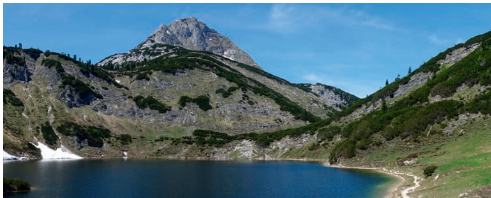
Rast am malerisch gelegenen Wildensee

Ein eindrucksvolle Etappen-Tour ist der Welser Weg im Toten Gebirge, vom Almtal bis nach Bad Ischl. In 5 oder 6 traumhaften Tagen wird das mächtige Plateau von Osten nach Westen durchquert. Der abwechslungsreiche Weitwanderweg hat nicht nur Bergwälder mit Fichten, Kiefern, Lärchen und Zirben und weite, blühende Almwiesen zu bieten, sondern auch ein stark verkarstetes Hochplateau mit versteinerten Muscheln, Schnecken und Korallen, Dolinen und Höhlen.