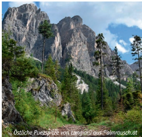
Östliche Puezspitze von Lungiarü aus

Die rund 600 Bewohner von Lungiarü sind Ladinier. Ladinisch ist eine romanische Sprache. Im Umfeld von Lungiarü gibt es ca. 30.000 Dolomitenladiner. Sie sind in Südtirol verteilt auf das Gader- und Grödnertal und haben sogar eine eigene Flagge. Ihre Farben sind das Blau des Himmels, das Weiß des Schnees auf den Gipfeln und das Grün der Wiesen und Wälder. Ladinisch ist lebendig: es wird im Alltag gesprochen, in der Schule gelehrt und ist in Südtirol neben Deutsch und Italienisch die dritte Landessprache.