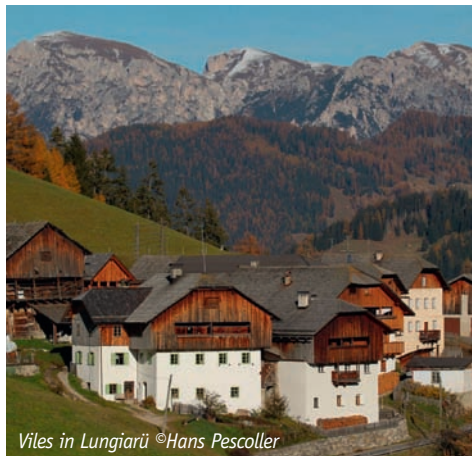
Viles in Lungiarü